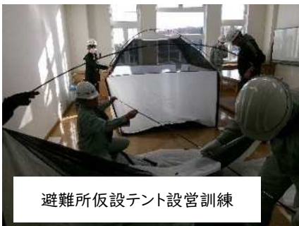
避難所仮設テント設営訓練