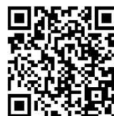
予約サイト二次元コード