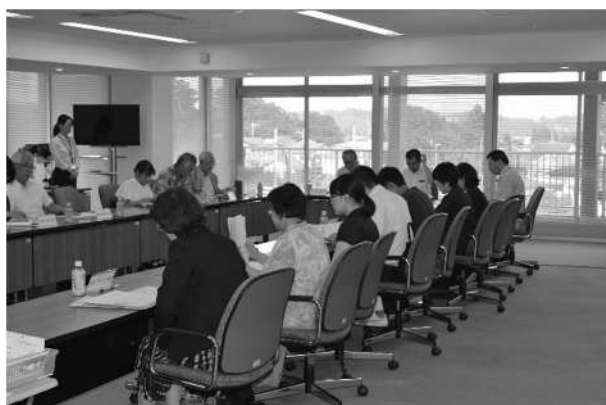
比企地区在宅医療・介護連携推進協議会

また、リストやマップを掲載し、この検索システムを市民に広く周知することで、市民が必要な情報を入手しやすくなるよう支援します。