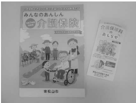
介護保険ガイドブック・介護保険料リーフレット