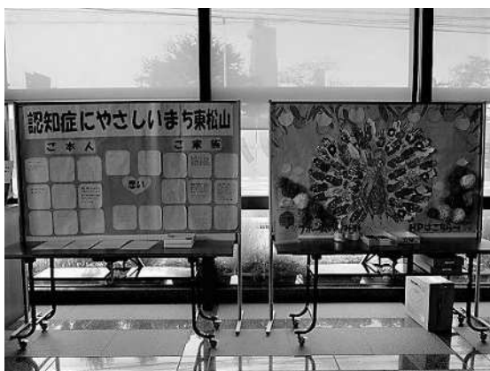
世界アルツハイマー月間における認知症キャンペーン

認知症家族介護者の相談窓口となる「認知症ケア相談室」の設置により、在宅で認知症ケアをされている方に介護の方法等について支援しています。相談内容により、若年性認知症支援コーディネーター（埼玉県配置）や関係機関等と連携を図ります。