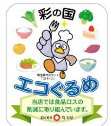
「彩の国エコぐるめ」 協力店の登録証

小盛りメニューの設定や、量り売りなど、食品ごみの削減に取り組まれている事業者を登録、事業者にはステッカーを配布し、ホームページで紹介しています。