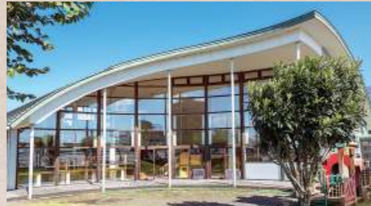
子育て支援センター「ソーレ」

0～3歳の乳幼児と保護者のための遊び、交流、情報交換の場です。「ソーレ」「マーレ」は、どちらも広いホールがある大型屋内施設です。初めての利用をサポートする「デビューの日」から「発育測定」や「離乳食体験」といった、子育てをサポートする講座が充実しています。手遊びや歌を楽しむ「ワイワイタイム」は毎日行われ、子育て世代には欠かせないスポットです。子育ての悩みも相談できます。