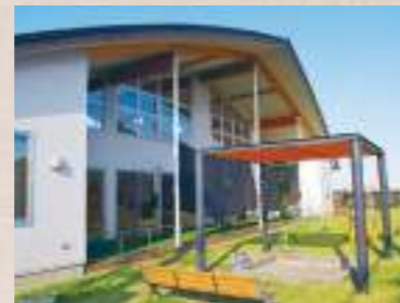
子育て支援センター「マーレ」