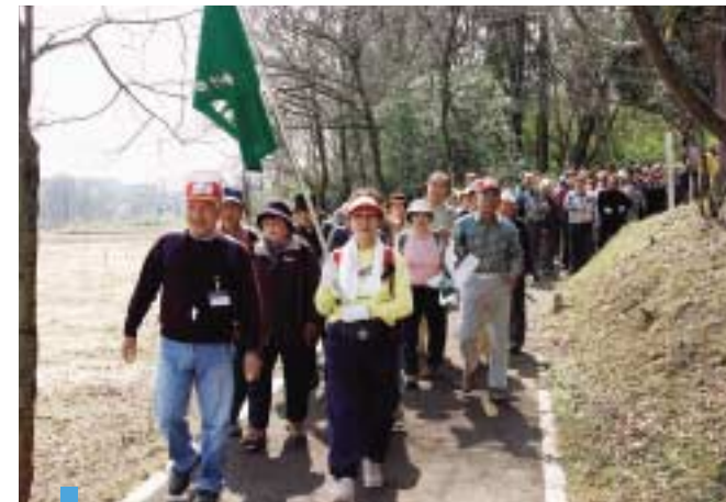
市民ウォーキング Citizen's Walk Rally 市内には6つの常設ウォーキングコースが整備されています。毎月開催される月例ウォーキングには大勢の市民が参加し、身近な自然や文化にふれながらウォーキングを楽しみます。

Good health is a prerequisite for an enjoyable life. The city strives to help every resident, young or old, lead a comfortable, fulfilled life. Sports and walking are promoted as ideal life-long exercises. Comfortable walking courses and sidewalks encourage residents to get out and go. Other sporting facilities are also provided to encourage each resident to engage in at least one kind of sport. The city also promotes peaceful living by providing substantial health, medical and welfare services.