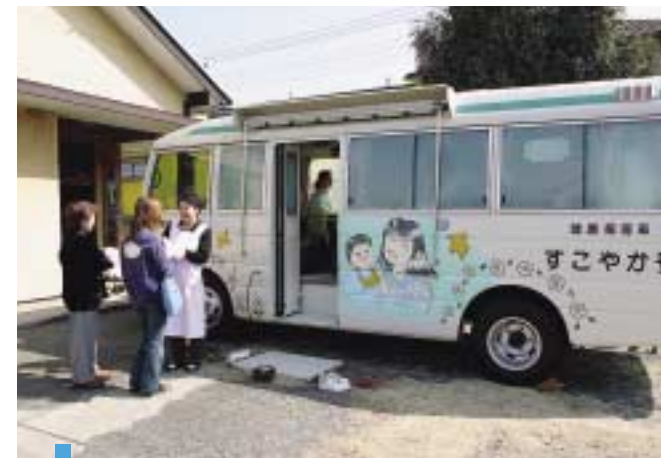
健康診査 Medical inspection 健康な暮らしのために、住民健診や歯科健診、各種予防接種等の事業のほか、健康指導車「すこやか号」が市内を巡回し、きめ細やかな健康診査・健康相談等を実施しています。