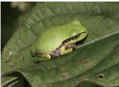
ニホンアマガエル

最近になり関東地方へ分布を拡大している。関西系の種で、10年以上前から荒川やその北部では生息確認があったが、2015年には滑川町、2016年には市内の滑川町に隣接している地域で確認した。身体には小さいいぼがあり、薄いクリーム色の体中線のある個体もいる。本庄市などでは水田で見られる種は本種だけになり、個体数も比較的多い。市内でも水田に分布を拡大すると考えられる。畑地でも見られ、乾燥に強いようだ。