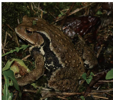
アズマヒキガエル