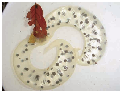
トウキョウサンショウウオ卵

谷津などの水田に春先にケツケツケ・・・と鳴いているが、近寄ると声を潜め、姿を見ることは難しい。アマガエルと同じような薄緑色の体色をしていて、水田に水が張られると、産卵を行い、泡の塊になった卵塊を見ることができる。しかし、市内での個体数は減少していて、多くは見られない。