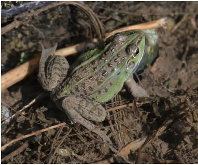
トウキョウダルマガエル