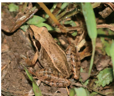
ニホンアカガエル

褐色の赤みがある種で、少しスマートな体型をしている。以前には普通種であり、個体数は多くないが、ときどき見られる種である。しかし最近では個体数が減少、市内では上唐子の都幾川で2017年3月初旬に卵塊を3個確認したが、稀に見られるような種になっている。近隣の山に近い場所にはヤマアカガエルがいるが、市内では見られていない。