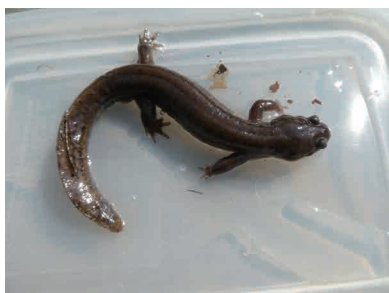
トウキョウサンショウウオ

成体は 15cm くらいだが、ほとんど見ることではない。よく出会うのは林の中の小さな水溜りに産まれた、三日月型で対になった卵囊 らんのお だけ。市民の森では 2005 年と 2013 年にも確認できている。絶滅危惧になって久しいが、それでも市内で見つけることができた。しかし、最近は何処を探しても、見つからない。本当に市内では絶滅してしまったかもしれない。本種は外来種であるアライグマが捕食すると聞く、またイノシシも食べていると聞く。この雑食性の中型から大型の哺乳類は 2000 年を過ぎた頃から生息数が急激に増加している。このような大型の哺乳類の出現により、浅い水辺に生息していた小さな生物が、深刻な絶滅危機を迎えている。