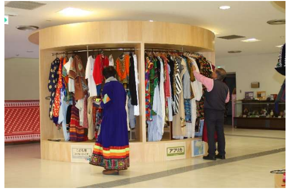
民族衣装コーナー