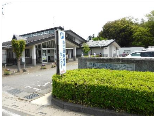
【健康増進センター】

地域の拠点として、月例市民ウォーキング、ハッピー体操など100以上の文化・運動等のサークル活動が活発に行われています。大ホールは各種講演会・演奏会などに利用されています。きらめき市民大学の課題研究発表会もこのホールで開催されます。会議室、和室、研修室、調理実習室、視聴覚室、大ホール（378席）があります。