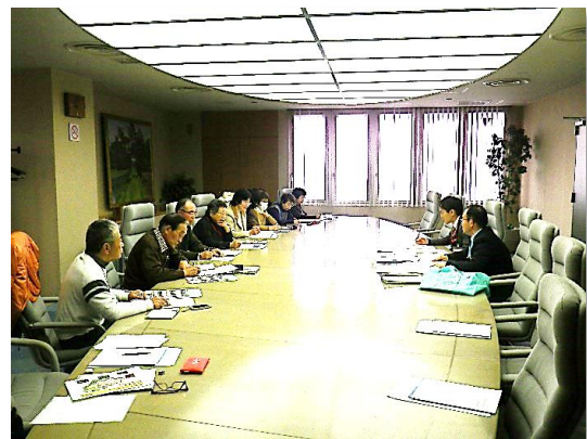
【市商工観光課講義】