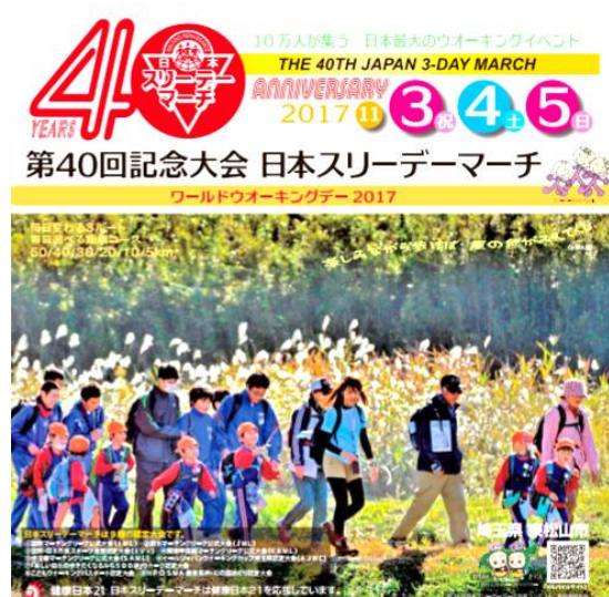
【日本スリーデーマーチ】

毎年 11 月文化の日と土日を入れて、武蔵嵐山ルート、森林公園ルート、都幾川・千年谷公園ルートとして 3 日間の日本最大のウォーキング大会で、毎年延べ 8 万人以上の参加者があります。世界各国、全国各地の歩く仲間との出会いと、ふれあいのウォーキングです。各コース(50 km・40 km・30 km・20 km・10 km・5 km)を自分の体力にあわせて自由に選び、3 日間自分のペースでのウォーキングです。昨年は 40 回記念大会で、100,998 人の参加がありました