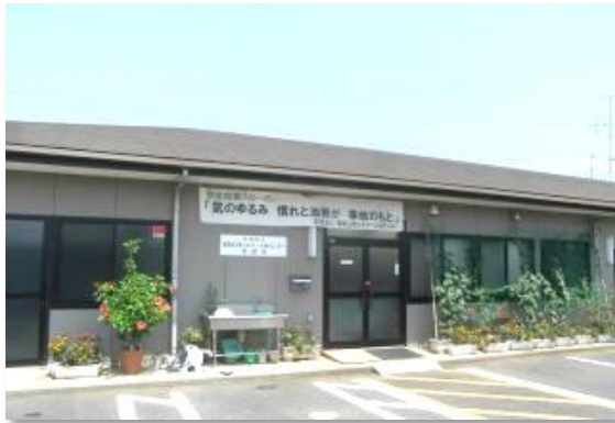
【シルバー人材センター】