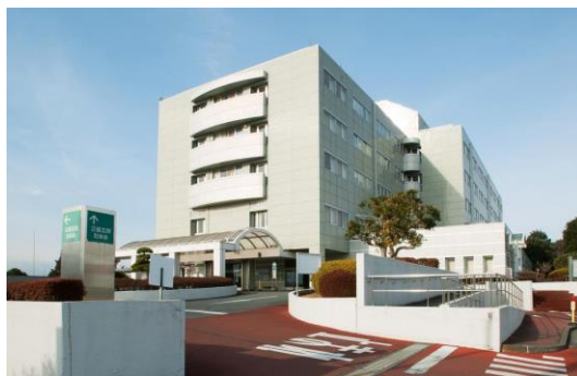
【東松山市立市民病院】