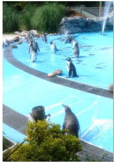
【こども動物自然公園】

総敷地面積 46ha の緑豊かな広大な土地に、コアラ、キリン、フンボルトペンギン他たくさんの動物がいます。小動物のふれあいコーナーもあり、最近では世界最小のシカ（プーズー）が、日本で初めて公開されました。冬場にはカピバラの温泉浴も見られ四季を問わず多くの子供達、家族連れで賑わいます。