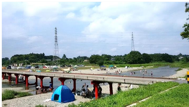
【くらかけ清流の郷】

馬の背に鞍をかけたように見える山があり、清流の元、鞍掛橋と名付けられた橋のもと、四季折々の風情が楽しめます。特に、バーベキュー場として家族連れ、友達等楽しく、憩いの場所になっています。