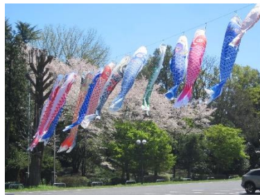
元気よく泳いでいます。

今年も4月3日(水)から、鯉のぼりを掲揚しました。今年も27匹を上げて元気に泳いでいます。鯉のぼりの掲揚も今年で18年目になりました。5月7日(火)まで鯉のぼりを掲揚しています。今年も強い風で鯉のぼり数匹が破損しましたが、交換しながら1ヶ月の間大勢の来館者が雄大な鯉のぼりを見学に来ていました。