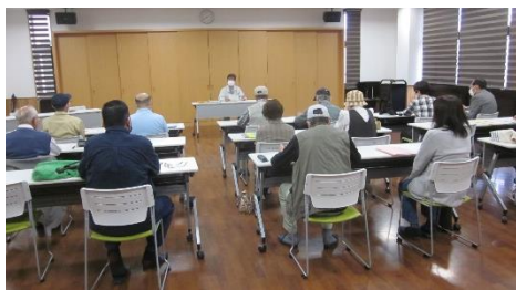
室内で講義を行いました

野本市民活動センター内の会議室で約1時間、花を植える前の花壇の準備から植付方法、花の育て方の講義を行いました。その後、野外で種まき実演指導を行いました。種まき方法や飼育箱の作り方の注意点などを勉強して頂きました。野本地区13名の代表が受講しました。