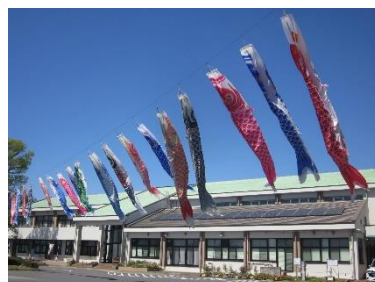
空高く泳いでいます。