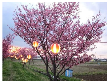
満開のさくらの里