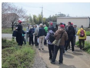
短いウォーキング実施

4月11日(木)ウォーキングリーダー養成講座が、唐子市民活動センターで開催されました。野本地区から推進員とウォーキングリーダー3名が参加しました。1時間の講習後に約3kmのウォーキング講習を実施して終了しました。