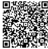
開花状況更新します