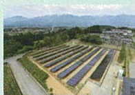
リユース品を使用した発電所