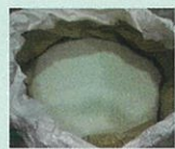
破砕・選別したガラス