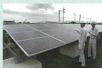
太陽光発電設備の検査の様子

使用済みとなった太陽光パネルには、再販売可能なものもあり、既に多くのリユース事例が報告されています。